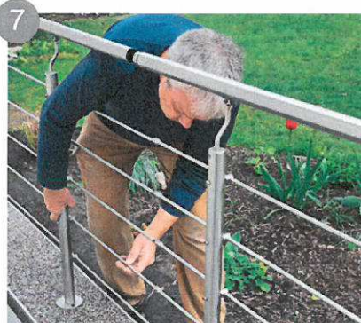
7 Raccordez les différents éléments entre eux