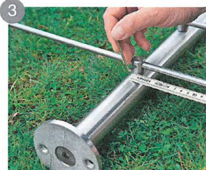
3 Répartissez les écarts entre les poteaux et laissez dépasser d'environ 20 cm à chaque extrémité