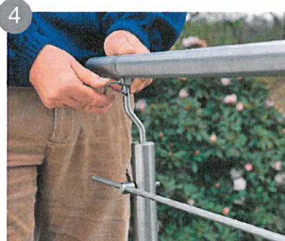
4 Redressez la balustrade et installez la main-courante (diam 40) sur le poteau