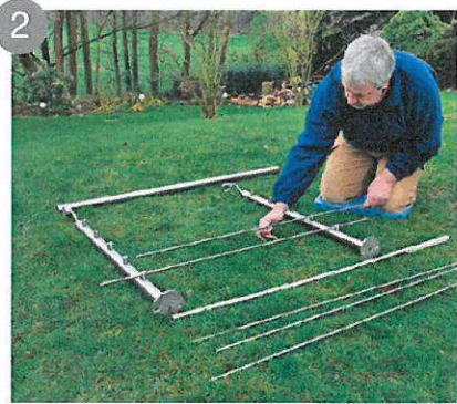
2 Insérez les barreaux dans les supports barreaux