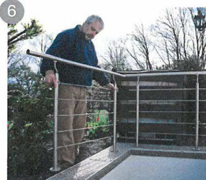
6 Redressez les éléments complémentaires, installez la main-courante et serrez les vis sans tête