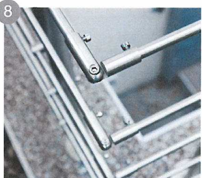
8 Utilisez pour les angles les articulations et fixez-les avec la clé Allen