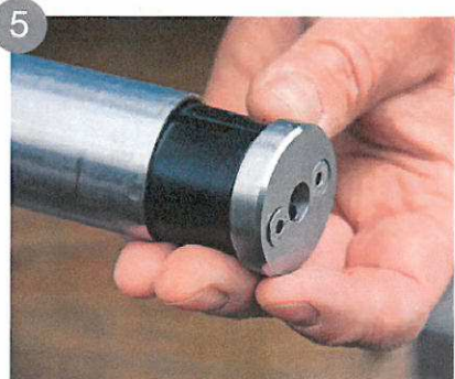
5 À chaque extrémité de main courante, vous disposez d'embout de finition ou d'adaptateur pouvant recevoir une articulation