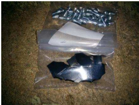
Sachet d'angle agrafé à son Sachet de visserie