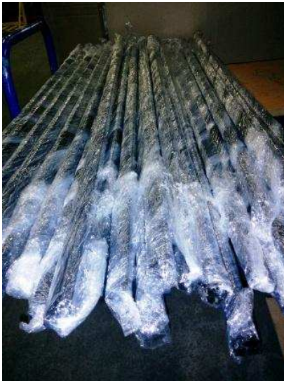
Une série de parcloses conditionnées par 6 (pour verrière de 3 vitrages)