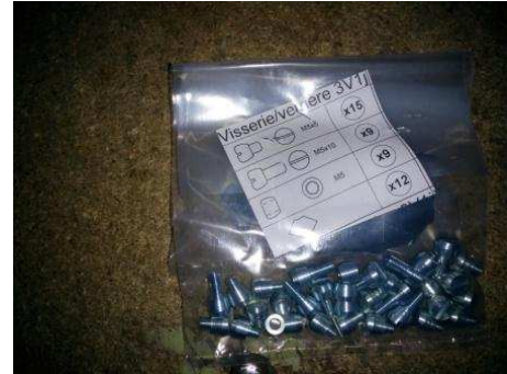
Exemple de sachet de visserie