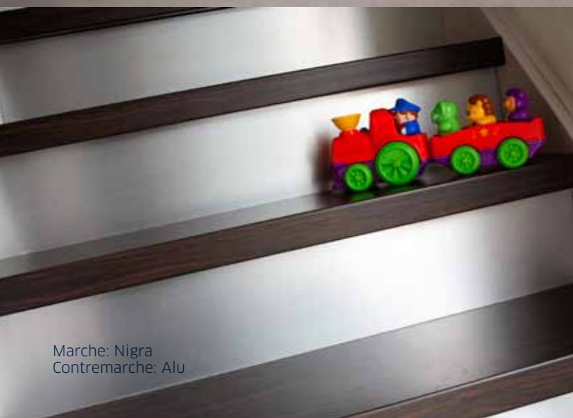
Marche: Nigra Contremarche: Alu