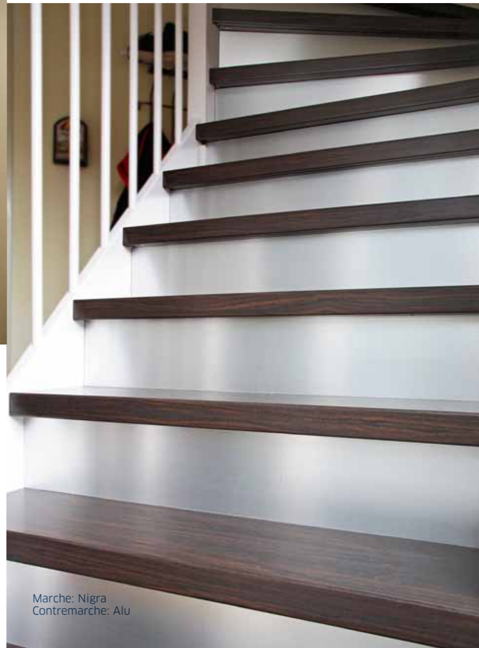
Marche: Nigra Contremarche: Alu

La forme et le support de l'ancien escalier ne posent aucun problème! Le concept de rénovation peut être appliqué tant sur des escaliers droits que sur des escaliers tournants. Les nouvelles marches et contremarches se fixent aisément sur des escaliers en bois, en béton ou en pierre naturelle.