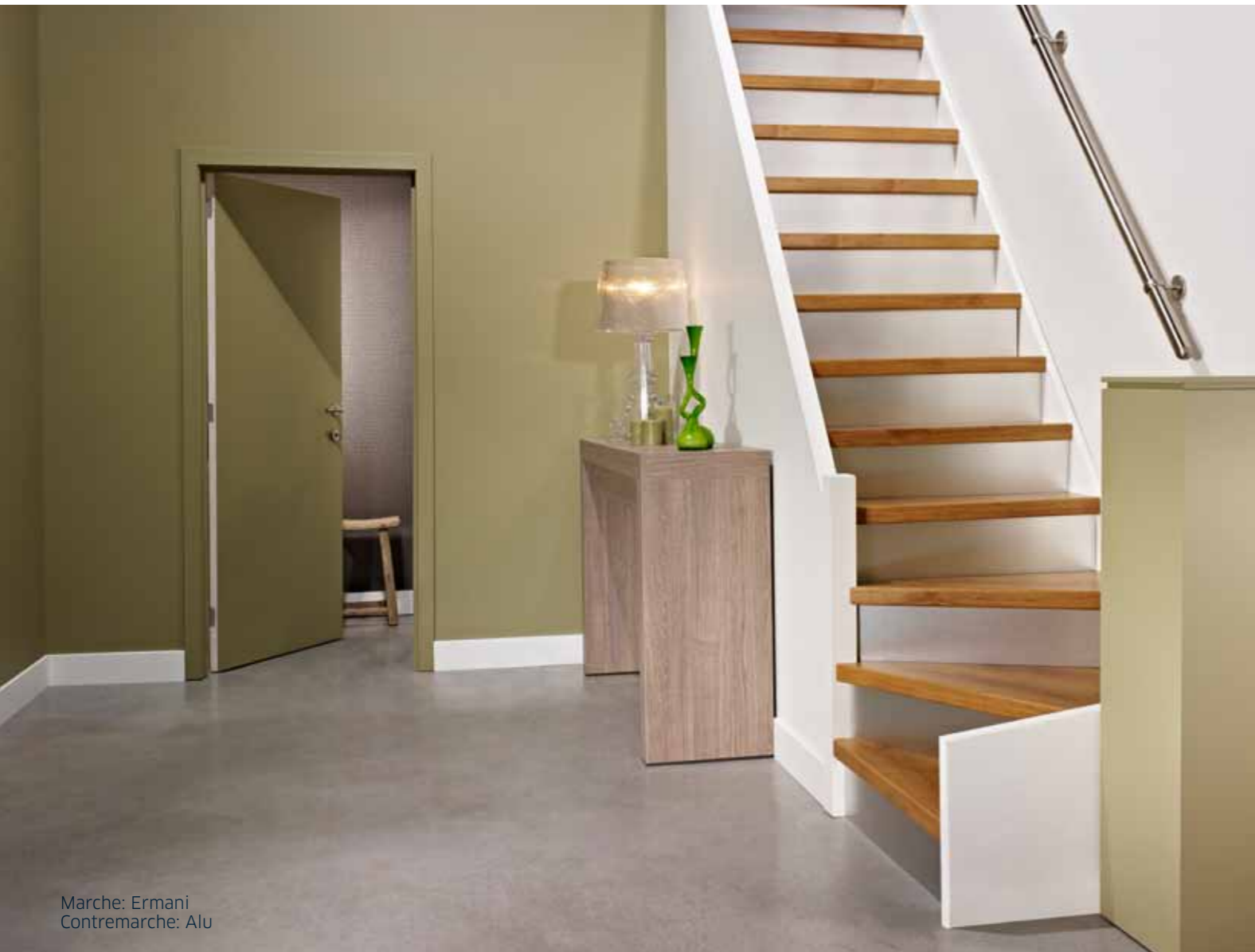
Marche: Ermani Contremarche: Alu