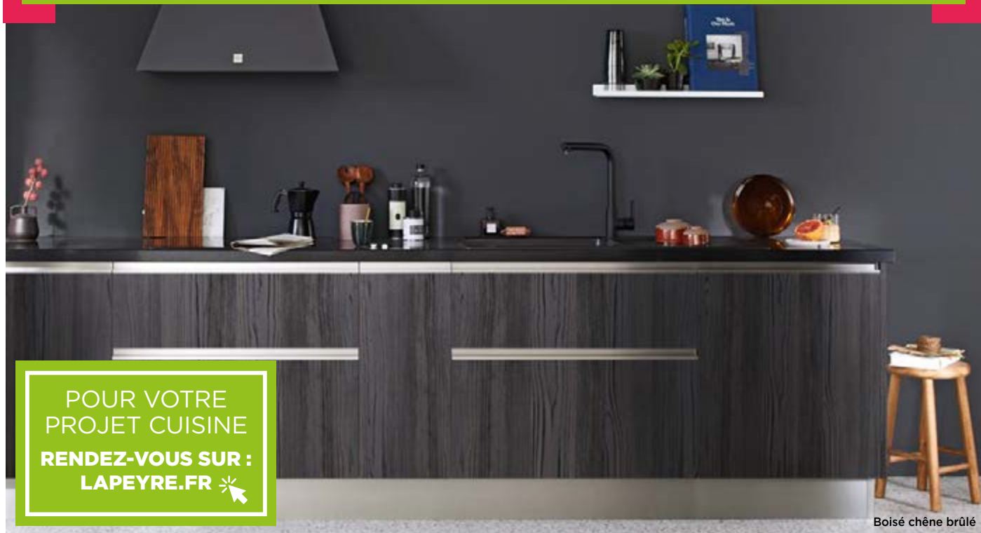
Boisé chêne brûlé

POUR VOTRE PROJET CUISINE RENDEZ-VOUS SUR : LAPEYRE.FR ✨