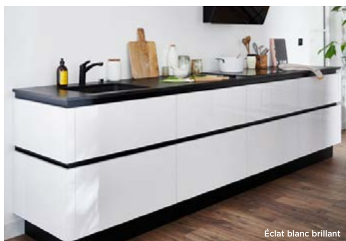
Éclat blanc brillant

POUR VOTRE PROJET CUISINE RENDEZ-VOUS SUR : LAPEYRE.FR ✨