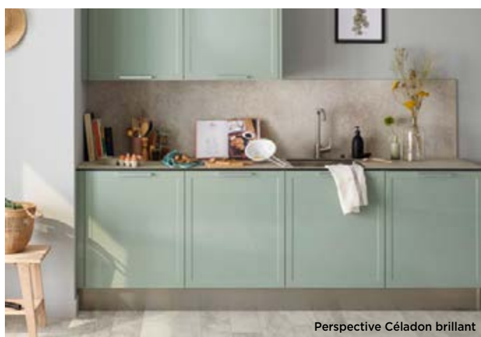
Perspective Céladon brillant